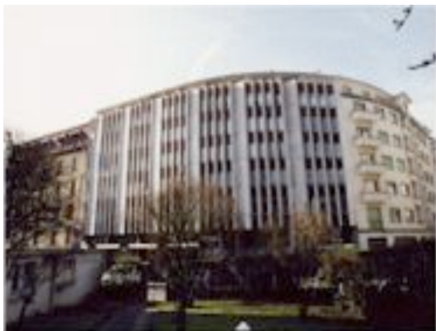
Foyer " Le Cazard " (1972)