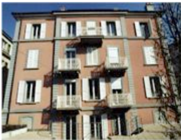
Foyer " Le Valentin " (1993)

Présenté par le Conseil de l'Association et la Direction du Cazard