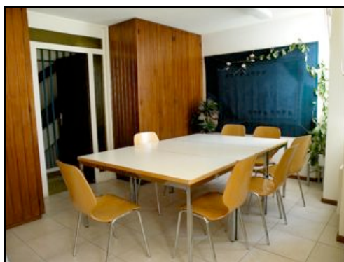
Salle du Conseil