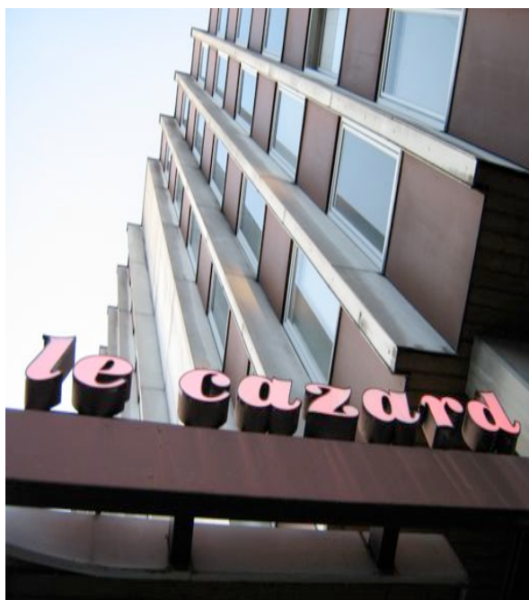
Foyer " Le Cazard " (1972)