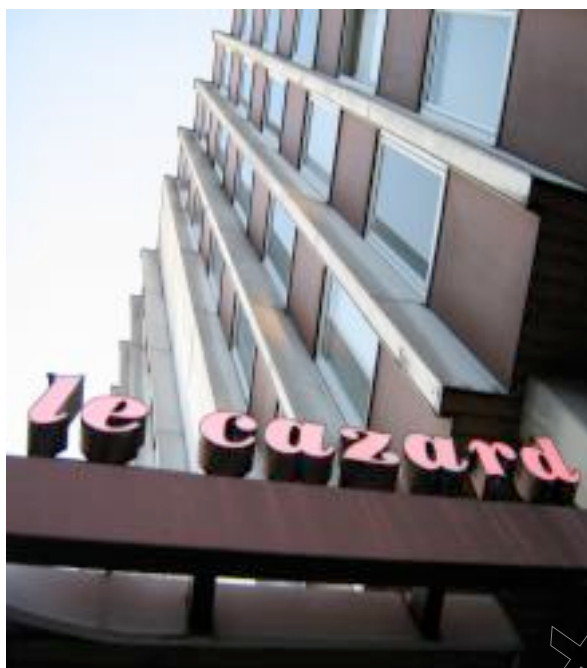
Foyer " Le Cazard " (1972)