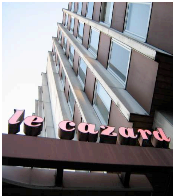
Foyer " Le Cazard " (1972)