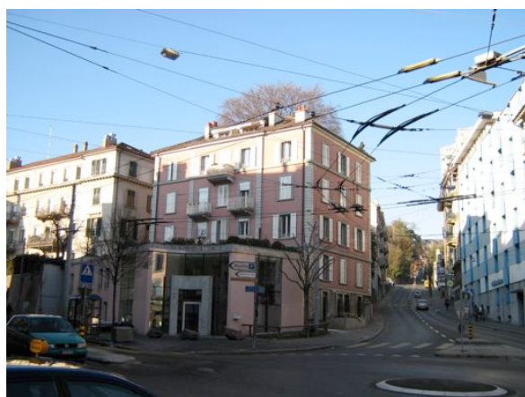
Foyer " Le Valentin " (1993)

Présenté par le Conseil de l'Association et la Direction du Cazard